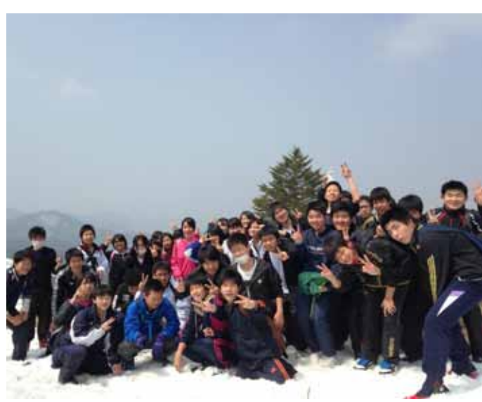
乗鞍の大自然に囲まれて団結だ