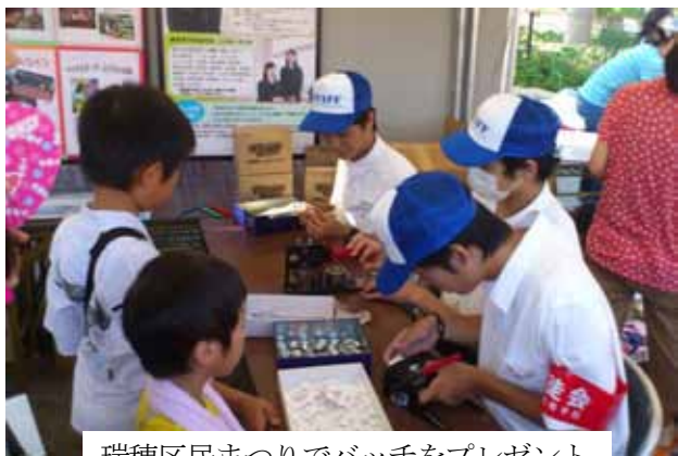
瑞穂区民まつりでパッチをプレゼント

活動内容は、学校周辺の地域清掃、〇の日の交通安全運動、瑞穂区民まつりのボランティア、安心・安全で快適なまちづくり運動、他校との意見交流会などです。