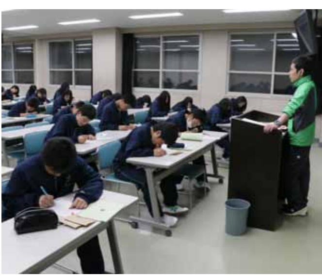
高校生活の目標を立てました

私は、この野外合宿で学んだり、得たりしたことがいくつかあります。 まず、時間の大切さを学びました。一学年で六百人いると、一つの行動をするにしても多くの時間がかかってしまうので、早めに行動しなければならぬということが分かりました。 次に学んだことは、友達関係のことです。野外合宿が始まるまでは、話せる人が限られていて、学校生活もあまり楽しくなかったのですが、行きたくはありませんでした。合宿の一日目は辛く、この先やっていけるのかなど不安でした。二日目のハイキングで次第に友達が増えて、徐々に楽しくなってきました。その甲斐があって、集いなどであいさつをする時、以前は恥ずかしかったものが、大きな声でできるようになりました。 この合宿で得たものや、学んだことを高校生活に生かしてがんばっていききたいと思います。