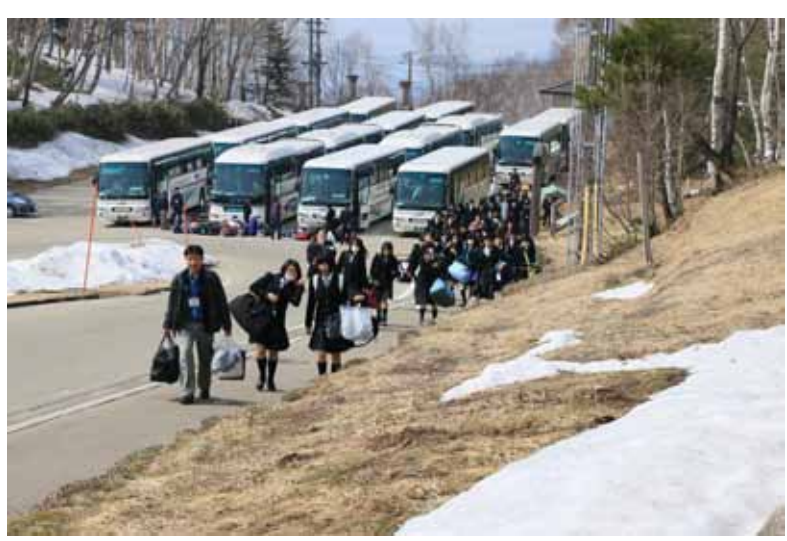
乗鞍到着 いよいよ始まるぞ

新入生オリエンテーション合宿 平成二十六年四月十六日〜十八日 国立乗鞍青少年交流の家