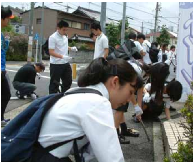
地下鉄川名駅付近にて

当日は、本校の生徒・教職員・PTA約四〇〇名が参加しました。八事興正寺から享栄高校までの約三キロをグループに分かれ、歩道を中心に清掃を行いました。