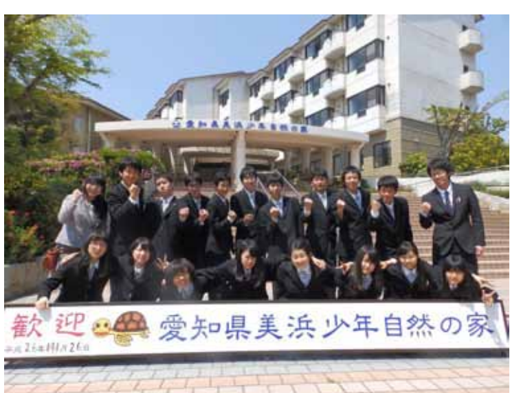
普通科躍進選抜コースⅡ期生17名