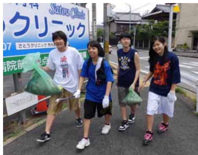
部活の仲間と楽しくできました