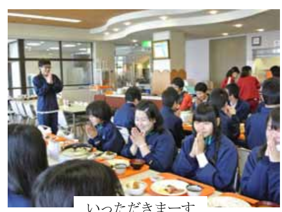
いただきますーす

この二泊三日の合宿は、自分にとって収穫の多い三日間になりました。 クラスの仲間たちとの絆や集団での行動の仕方など、これから三年間の高校生活を過ごすために重要なことばかりでした。 この合宿で学んだことや、決意・抱負を忘れずに自分の目標を達成できるように努力していきたいと思っています。