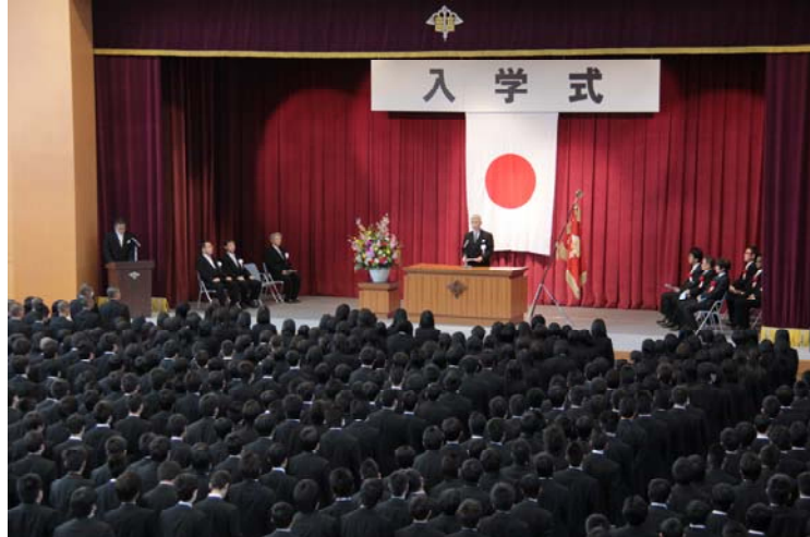
平成24年度入学式 4月7日