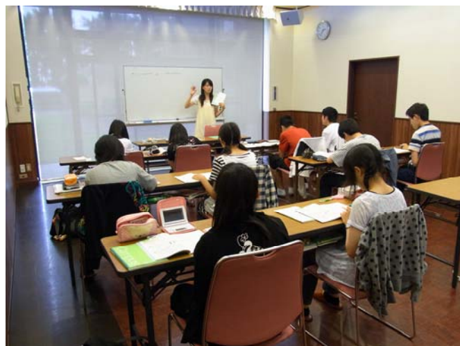
問題演習に取り組む生徒たち 白浜荘にて