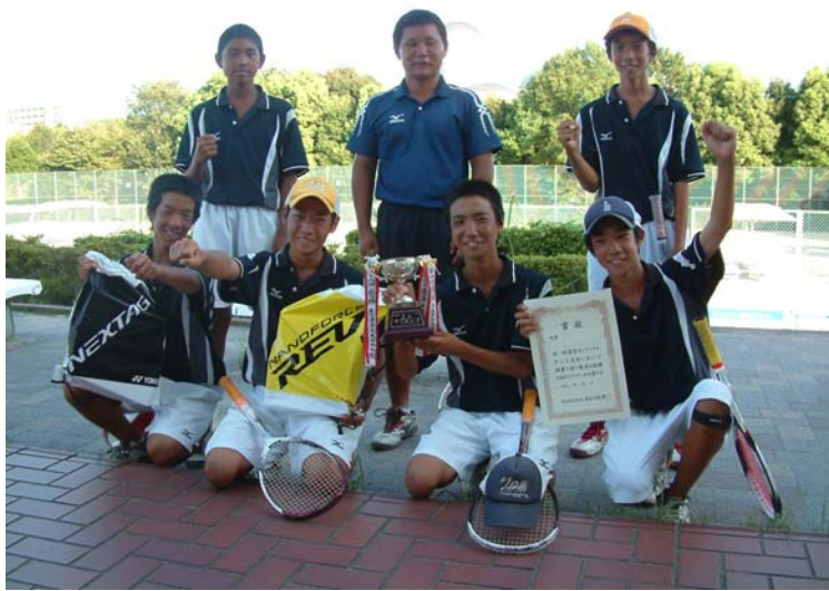
優勝した逢妻中学校の選手たち