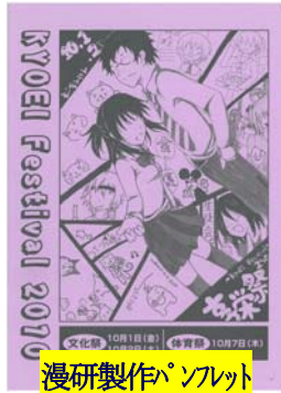
漫研製作パブリット

享栄祭(文化祭・体育祭)が十月に実施されました。特に、二年生の修学旅行先が「韓国」ということもあり、それに関する企画・展示が多く見られました。また、三年生とPTAが中心の模擬店では、韓国風のチジミやチャーハンなどを扱うクラスもあり、大人気でした。体育祭ではクラスが一致団結し、クラス対抗の得点を競いあいました。