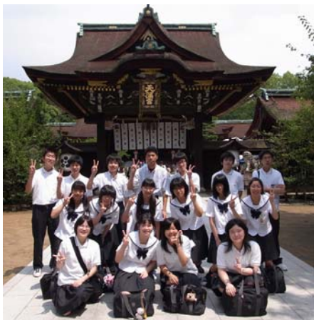
京都北野天満宮にて

私たち特進コースの生徒は夏季休業中に三泊四日の合宿を行いました。一日目、二日目は一日中授業を受けたり、自習をしたりしました。合宿中はいつもの授業より三〇分も長い八〇分授業でした。先生に個別指導をしてもらえたので、苦手な分野もすっかり理解することができました。就寝前にも自習の時間があり、とてもハードでしたが、上級生や下級生ともいっぱい話すことができ、仲良くなりました。 夜のバーベキューや花火大会なども楽しく、息抜きには最高でした。最終日には北野天満宮に行き合格祈願をしたり、清水寺では京都の街並みを散策したりするなど、とても有意義な合宿でした。