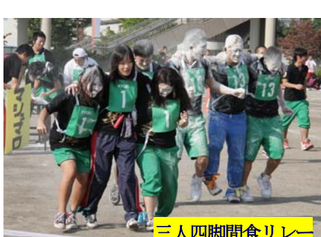
三人四脚間食リレー